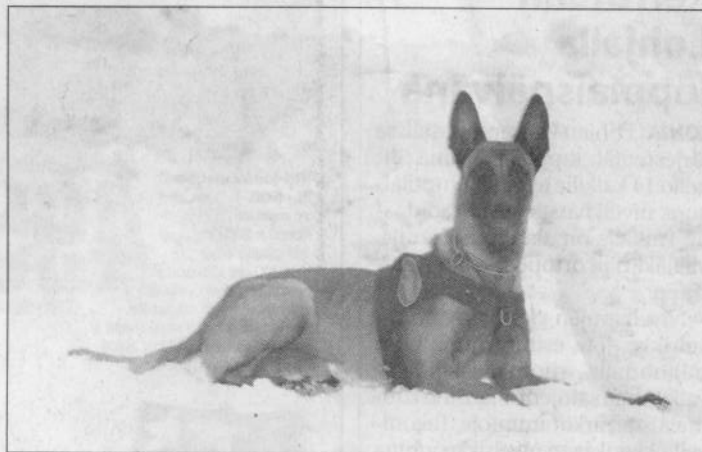
Työ kutsuu. Sauli valjaissaan valmiina virkatehtävään.

– Se on oman lauman kesken hyvin sosiaalinen koira, joka osaa täydellisesti myös rentoutumisen jalon taidon, hymyilee Rytönen ja rapsuttaa Sauliaan hellästi. Koira sulkee silmänsä ja painautuu ohjaajansa rintaa vasten korvat lurpallaan. Koiran ja ohjaajan välinen luottamus on käsin kosketeltavissa.